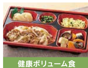
健康ボリューム食