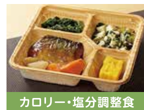
カロリー・塩分調整食